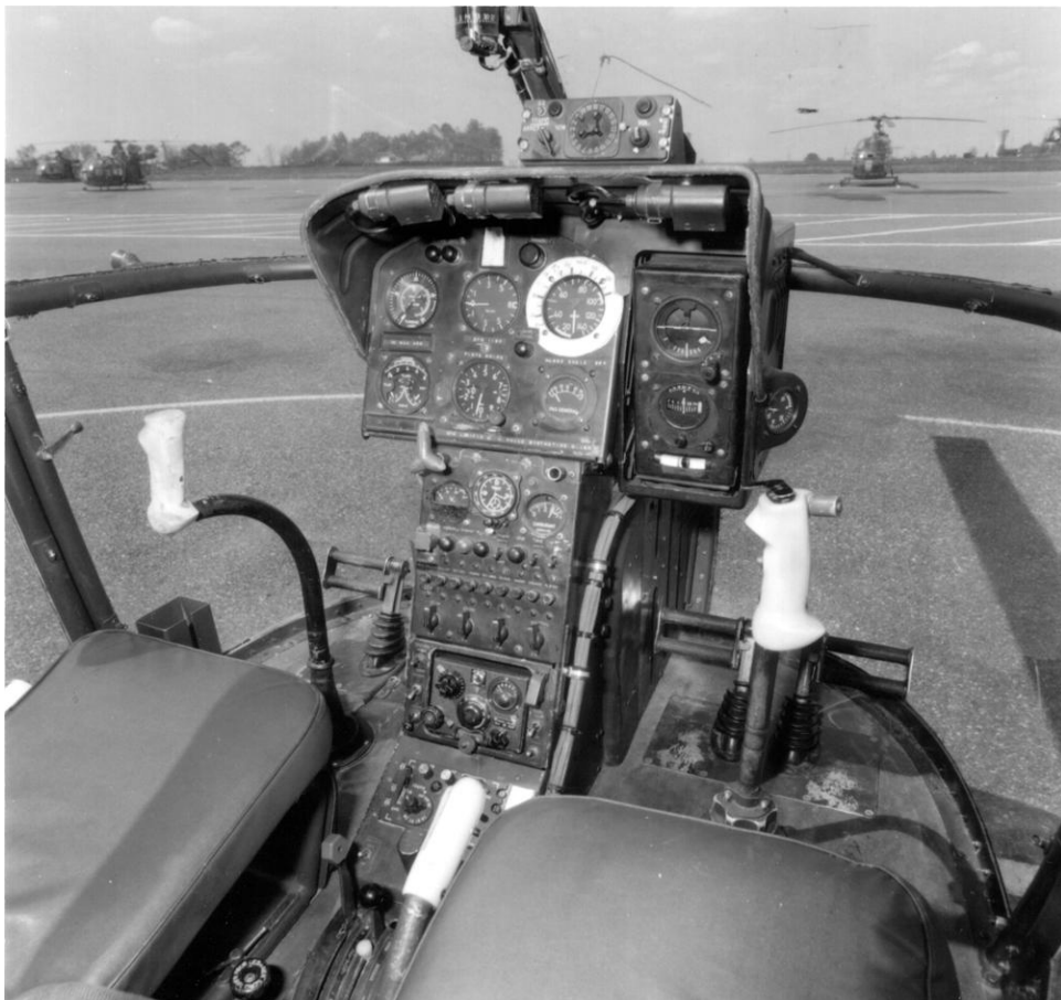
Tableau de bord d'un Bell G-2, en 1977 (photo Arthur Smet)..

(source : Manuel d'utilisation des hélicoptères Bell G1 et G2, ESAM, août 1961.)