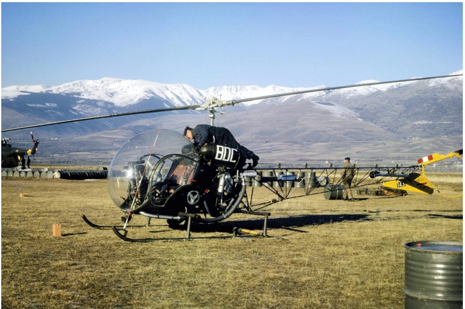
Agusta-Bell 47G-2 n°143/BDC de l'ES.ALAT à Saillagousse en 1963 (photo Jean Davanne).