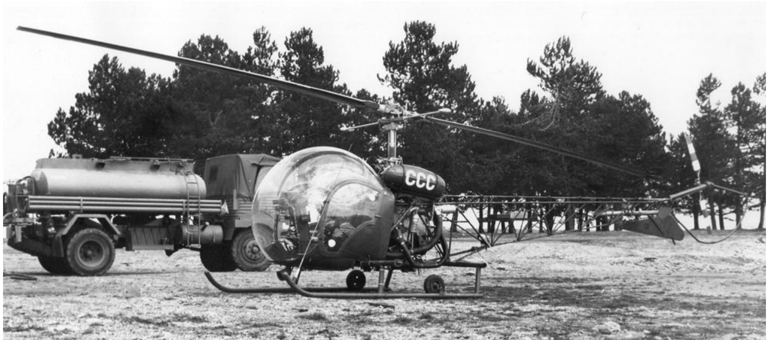
Agusta-Bell 47G-2, codé CCC, de l'EALAT-EAI au camp du Larzac en mars 1975. (photo Pierre Labaudinière).