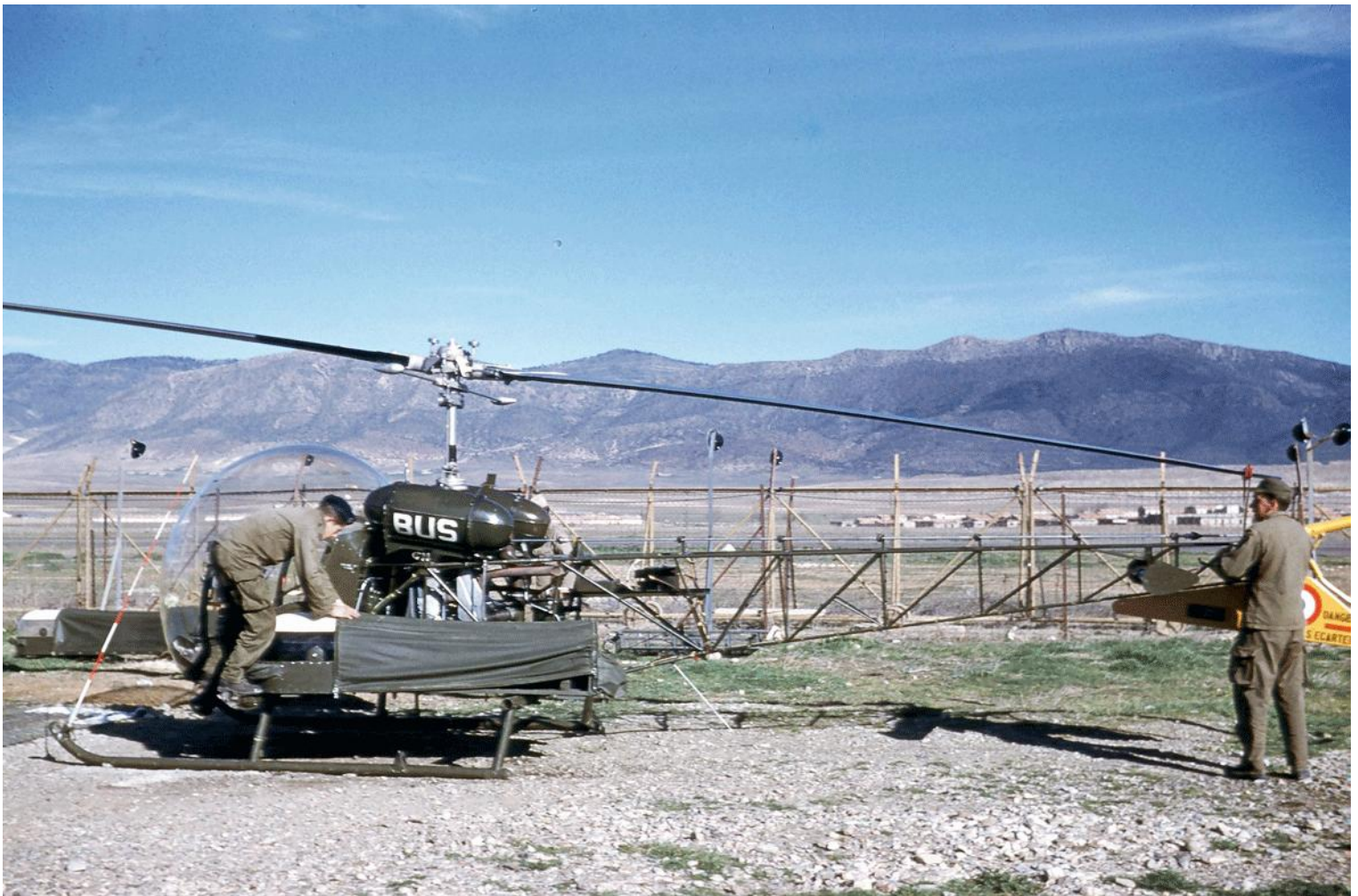
Batna, le 20 février 1960, Agusta-Bell 47G-2 n° 127/BUS, du 1 er PMAH de la 21 e DI.