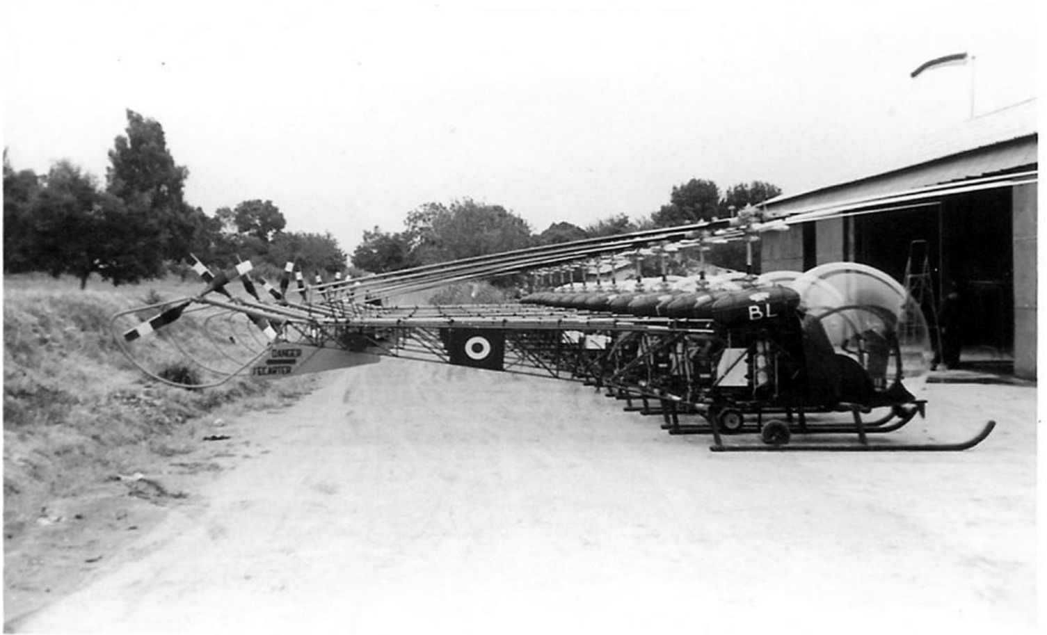
Alignement des 12 Agusta-Bell 47G-2 du GH N°3. Au premier plan, le n° 127/BL.